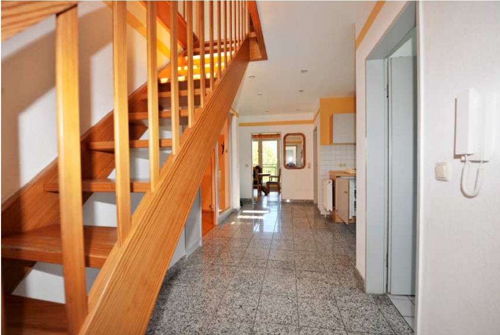
Flur mit Treppe ins Obergeschoss