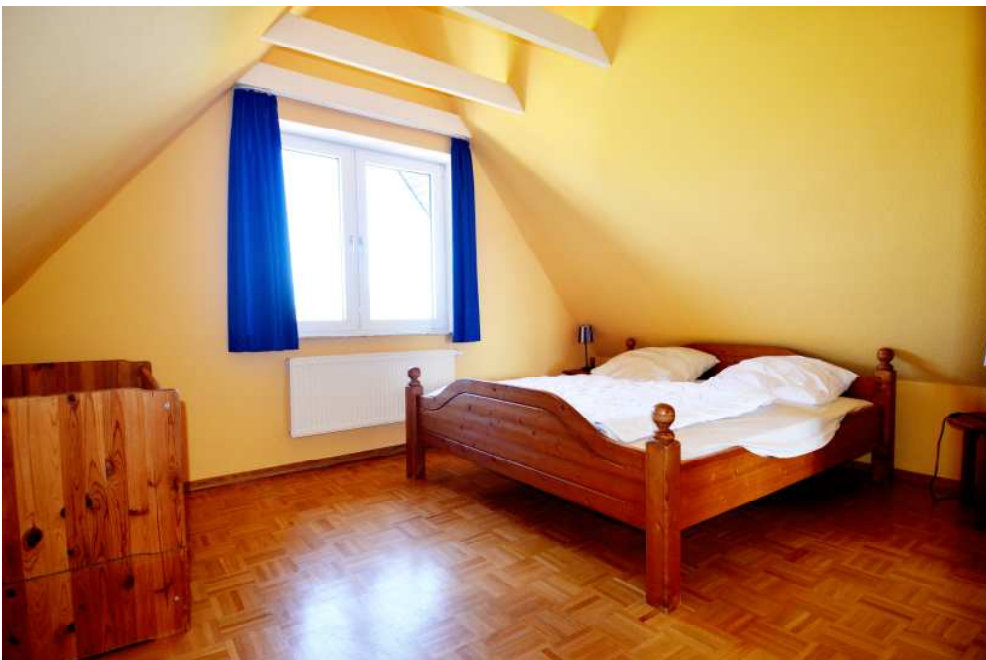
Drittes Schlafzimmer im Obergeschoss