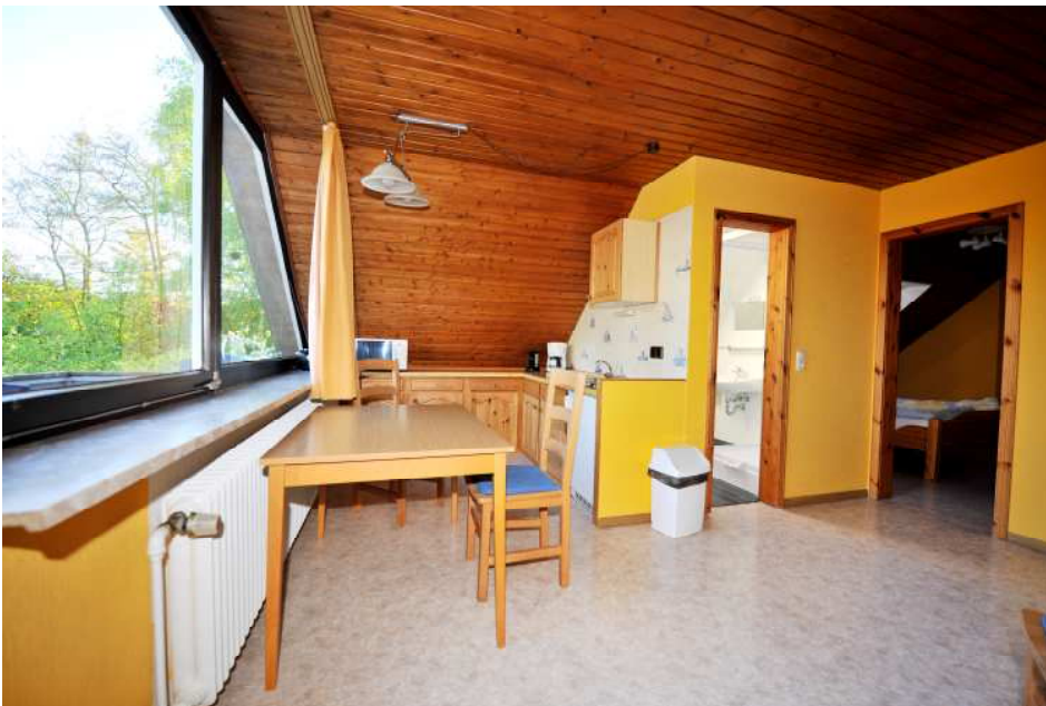
Essbereich mit Küchenzeile